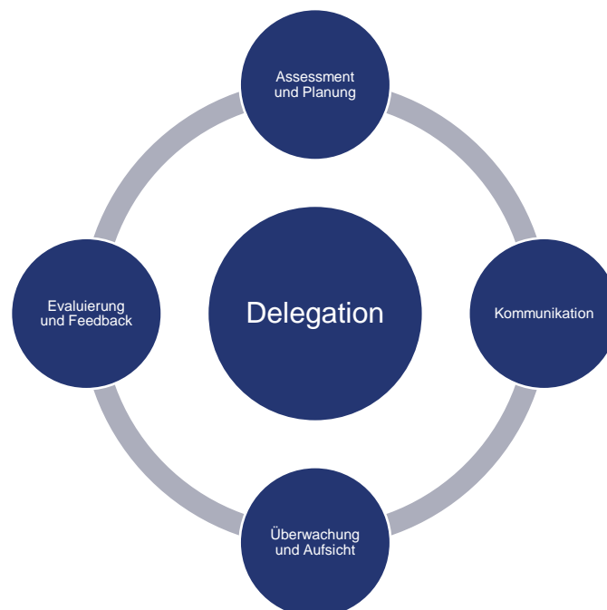
Abbildung 4: Delegationsprozess