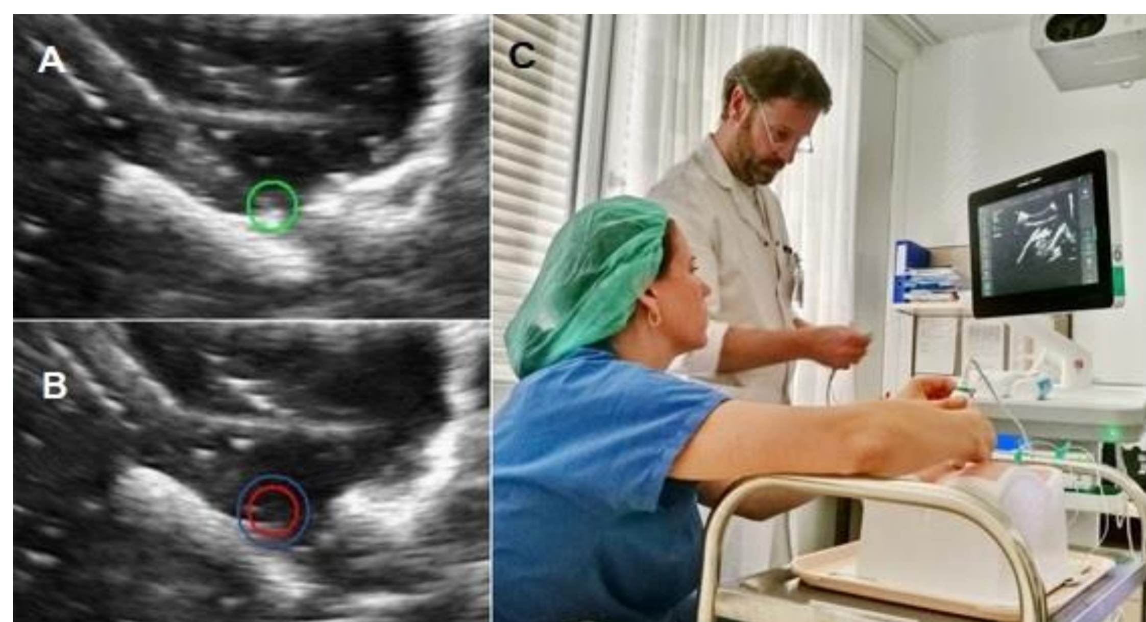
Abb. 1: Die Onvision Needle Tip Tracking (NTT) Technologie nutzt einen Sensor an der Nadelspitze, um deren aktuelle Position im Ultraschallbild zu berechnen. (A) Mittels eines kleinen grünen Kreises wird diese dargestellt, sofern sie sich in der Schallebene befindet; (B) ist die Nadelspitze außerhalb der Schallebene wird diese mittels eines roten Kreises markiert und der blaue Kreis verkleinert/vergrößert sich in Abhängigkeit der Bewegung zum/von der Schallebene weg. (C) Versuchsablauf.